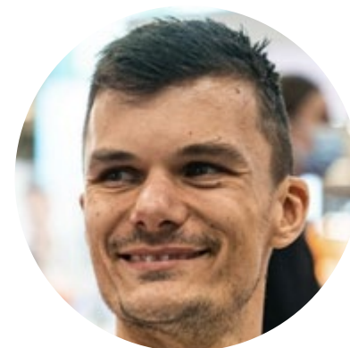
Hem ton kiné